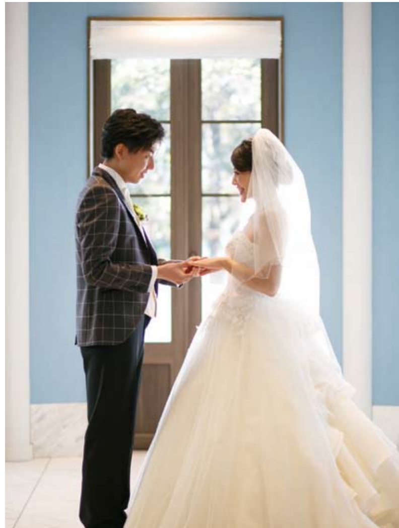
▲自然光が差し込む挙式会場では笑顔も溢れる。挙式は1日1組限定で、自分たちらしいウエディングが叶えられる