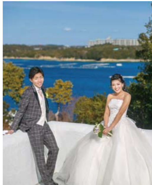
▲英虞湾をバックに撮影。どこにいても絵になるロケーション