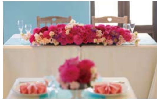
▲水色の壁がさわやかなイメージの披露宴会場。前にはウッドデッキが広がり、海が一望できる